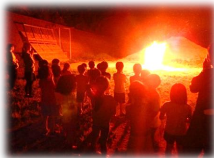
キャンプファイヤーで 大きな炎を体験!!