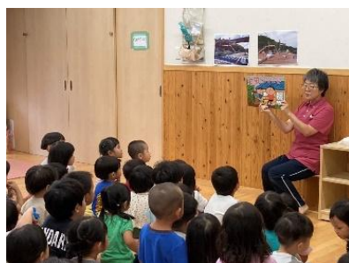
みんな真剣に話を聞いて いました!