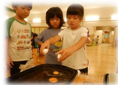
朝6時：目玉焼きづくり!