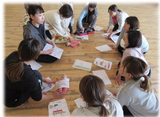
SIDS・けいれん対応の研修を行いました