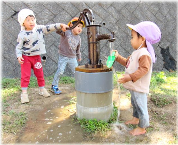
ポンプ カを合わせて「ジャー！」

その他にも子どもたちが夢中になって遊びこめるよう、園内外の環境を準備していきたいと思います。