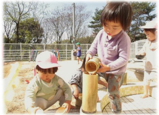
どこまで入るかな